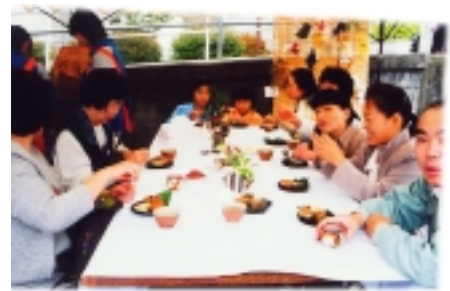
ふるさと広場の新企画「いっぷく茶屋」も満席です

北条条中学校ブラズバンド部の演奏で幕開けですが「金賞」受賞の演奏は観客の胸を熱くしました。