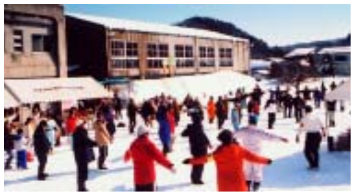
当日は快晴、きれいな朝でした