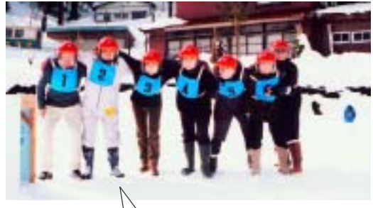
地区外からもPOTチームが参加