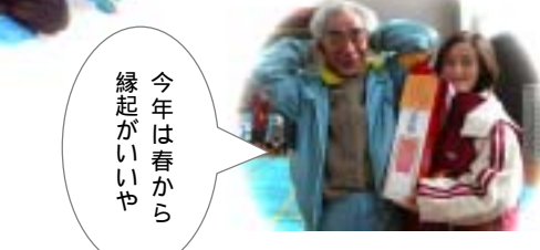
今年は春から縁起がいいや