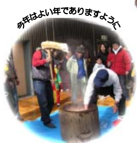
今年はいい年でありますように