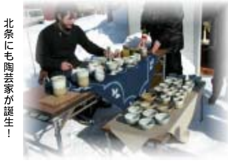
北条にも陶芸家が誕生!