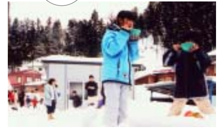
コミュニティのうどんはいつもおいしいね