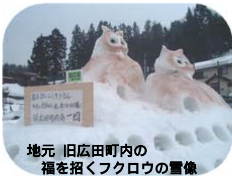
地元 旧広田町内の 福を招くフクロウの雪像

ただ、悪天候により、屋台の開店やキャンドルの点火及び終了時間が変更となり、案内時間にお出かけいただいた皆さまにご迷惑をおかけしましたことをお詫び申し上げます。このフェスティバルが地域に根ざしたイベントに成り得るよう、皆様のご意見、ご感想をお願い申し上げます。御礼とさせていただきます。