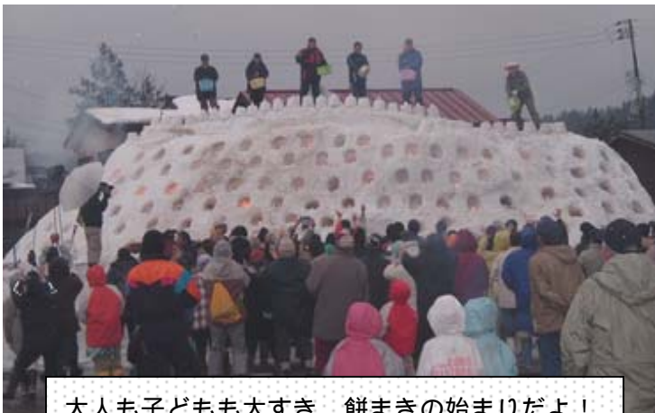
大人も子どもも大すき 餅まきの始まりだよ！

ストラックアウト、 賞品もらえるように ガンバルからね！ みんなで食べるご飯っ ておいしいね。