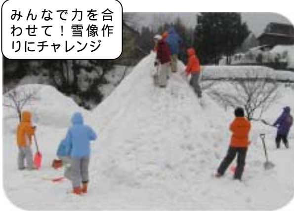
みんなで力を合わせて！雪像作りにチャレンジ