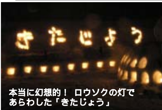
本当に幻想的！ロウソクの灯であらわした「きたじょう」