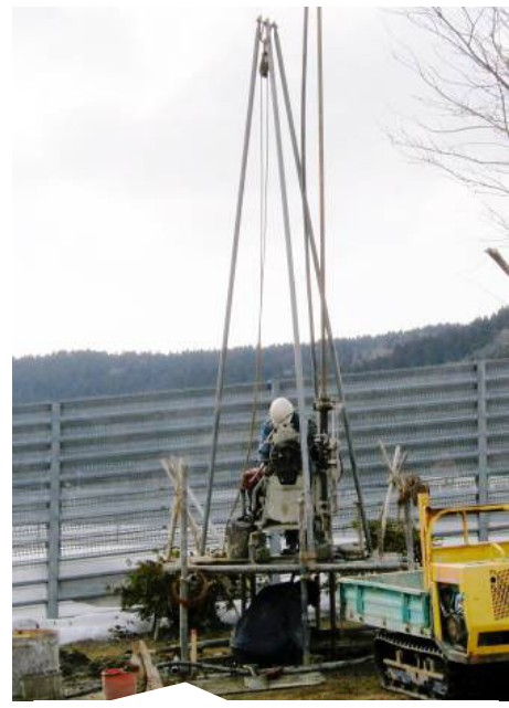
いよいよ始まった、準備工事の様子(地質調査)