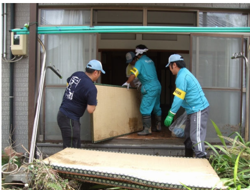
床上浸水した畳を運び出す（大広田）