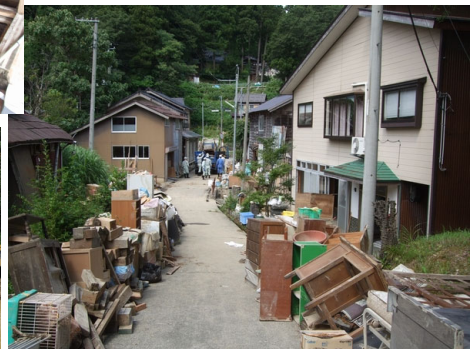
一階の家財道具は全滅（大広田）