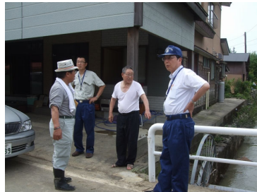
会田市長視察（広田川にて）

上げ作業に汗を流してくれた。また、地元消防団員や柏崎消防署員有志等は側溝や庭の泥上げなどの重労働な作業に積極的の取り組んでくれた。ほか協力いただいた大勢のボランティアに感謝！感謝！ 八月二日、柏崎市長が現地を視察、同日夜は床上浸水された世帯を対象に市担当課が説明会を開催した。翌八月三日午後五時、地域防災会の本部は閉鎖した。