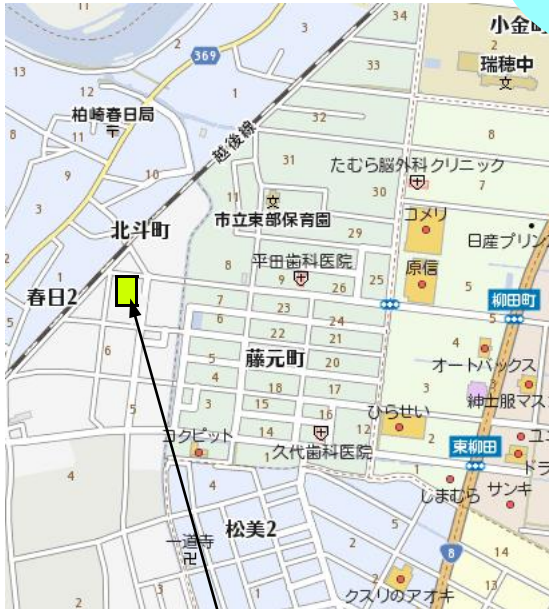
ハーモニー北斗町