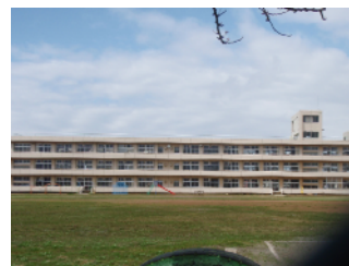
比角小学校まで 徒歩14分

物件所在地 柏崎市松美1丁目660-21 地目 畑 都市計画 無指定 用途地域 第一種住居地域 建坪率 60% 容積率 200% 現状 宅地 設備 電気、ガス、上下水道 農地転用費用有り 地勢 平坦 引渡時期 即時 仲介手数料別途 取引態様 専任媒介 実測面積にて売買 学校 比角小学校、第2中学校区 交通 JR越後線東柏崎駅から徒歩13分 松美町バス停より徒歩7分