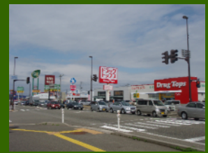
グリーングリーン