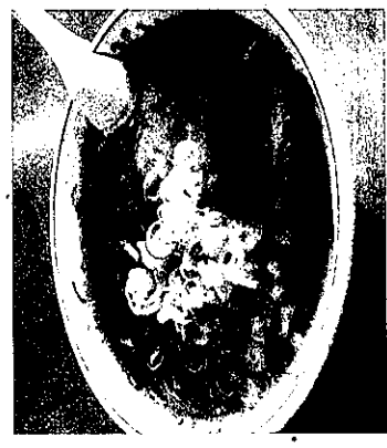
「オーモリラーメン」のラーメン。豚骨しょうゆラーメンで、臭みがなく箸が進む

「県内の新聞やテレビ雑誌でラーメン特集が組まれ、ラーメンを食べに行く人が増えた。みんな食べに行くからラーメン店が増えるという形で業界全体が盛り上がったんだと思う。その証拠に、人口10万人あたりのラーメン店の数は、新潟県は全国で上位に入る。また、新幹線や高速道路で東京とつながっていたこと