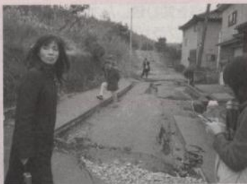
フォーラム翌日、参加者は山古志村と柏崎の被害状況を視察