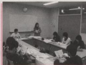
派遣者事前研修の様子

帰国後の4月13日(日)にはスタディツアー体験報告会(午後1:30～市民プラザ学習室201)を行い、自分たちの目で見た今の韓国、学校訪問やホームステイの様子を発表します。事前申し込みは不要ですので、ぜひお越しください。(入場無料)