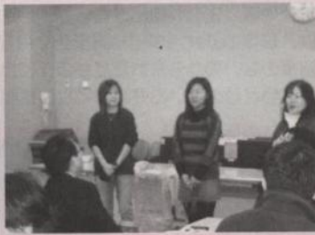
現地視察会で被災体験を語る留学生