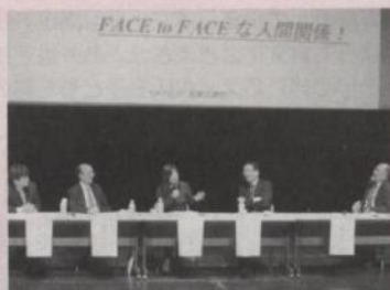
これまでの震災経験を踏まえ、多言語による情報発信と、広域連携の必要性が熱く語られました

*「柏崎災害多言語支援センターの活動」および「柏崎市在住外国籍住民へのアンケート集計報告書」は、当協会ホームページ上に公開しています。URL http://www.kisnet.or.jp/~kokusai/