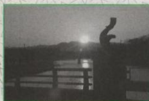
「八坂橋の日の出」R.Kさん