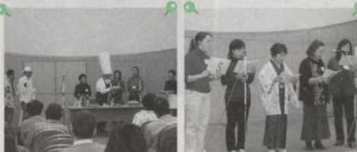
スペイン語クラスの寸劇

今年で4回目を迎えた語学講座の学習発表会。日頃学んだことばを使って歌や朗読、劇などを披露しあい、国や世代を超えた交流を楽しみました。