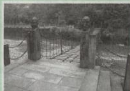
詩碑近くの吊り橋