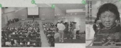
市民プラザで上映前の様子