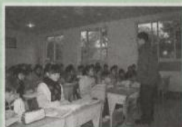
仮設校舎での授業風景