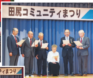
先生がいなくても 頑張りました