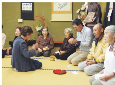
◀ 抹茶をいただくと 気持ちが落ち着くね