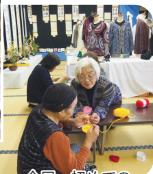
今回、初めての 手編み体験!!