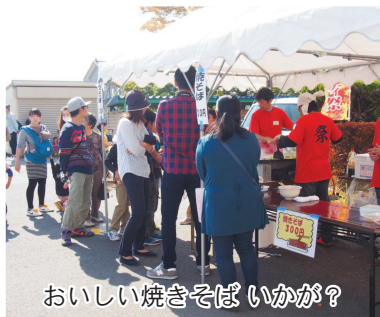
おいしい焼きそば いかが?