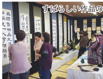
すばらしい作品の数々