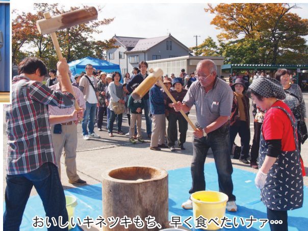
おいしいキネツキもち、早く食べたいナァ...