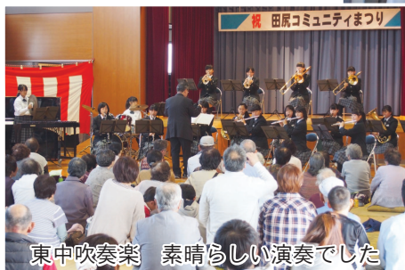
東中吹奏楽 素晴らしい演奏でした