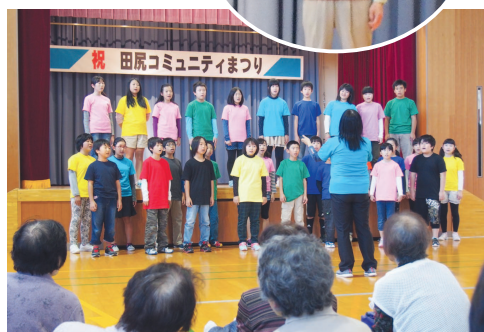
きれいな歌声の田尻小合唱部