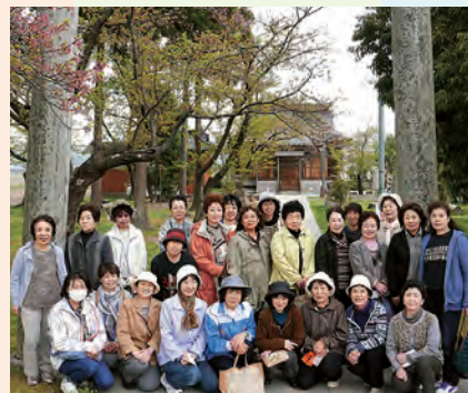
お花見会 ～上田尻町内散策～