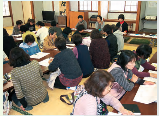
平成28年度ボランティアさくら会総会