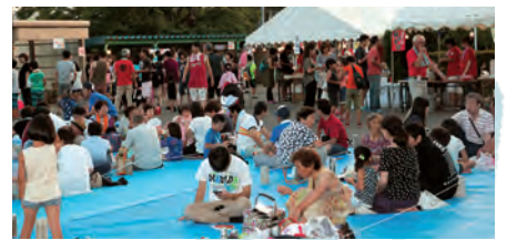
町内ごとにシート席を用意。 まずは腹ごしらえです。