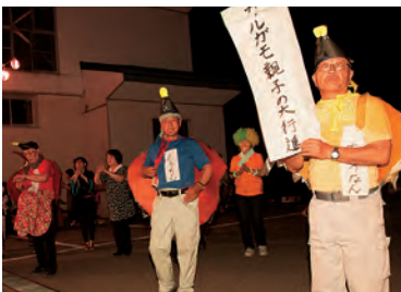
仮装部門 第1位は カルガモ親子の大行進!