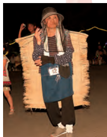
仮装部門 第2位は スーパーウーマン!?