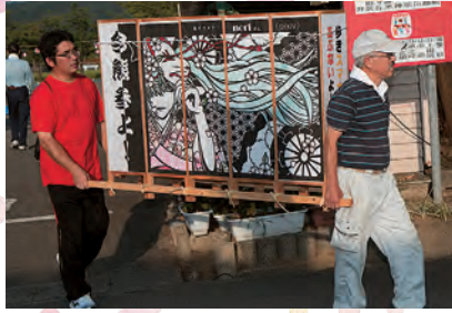
大作を慎重に運びます。 絵あんどんの準備の様子。