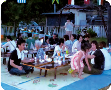
暑いけど、屋外での一杯は旨いです！