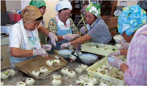
心がこもったおにぎりです。 ありがとうございます！