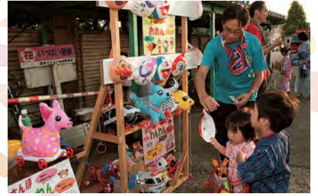
お面やコロコロわんちゃんの販売は 子どもたちに大人気！