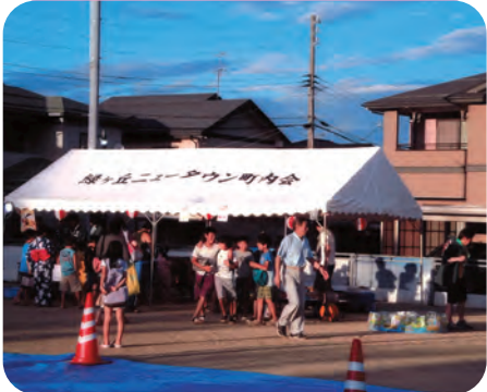
テントの中ではお楽しみが…