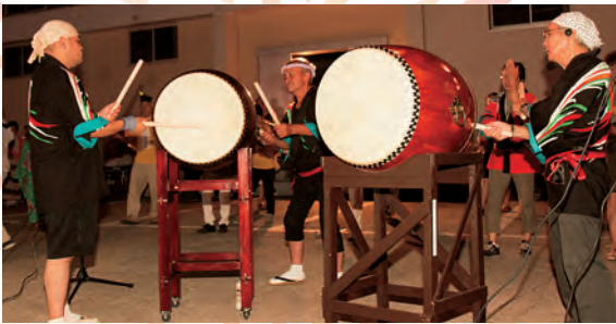
おんどこ会の皆さんによる演奏。 盆踊り大会には無くてはなりません。