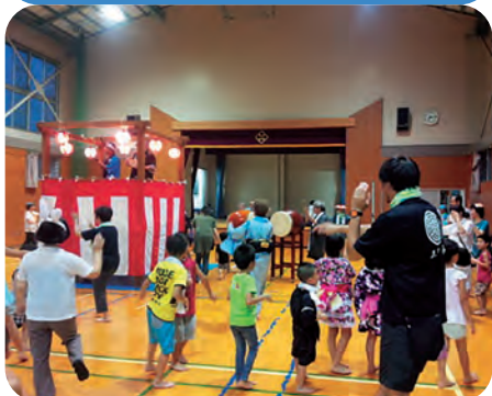
みんなで一つの輪になって!!