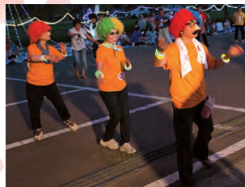
仮装部門 第3位は 楽しそうに踊る陽気なる人組!