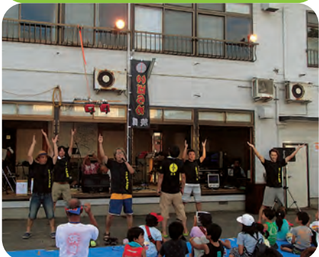
地元のアイドル!?! が歌と踊りを披露!!