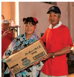
お楽しみ抽選会、 豪華景品当たったよ!!