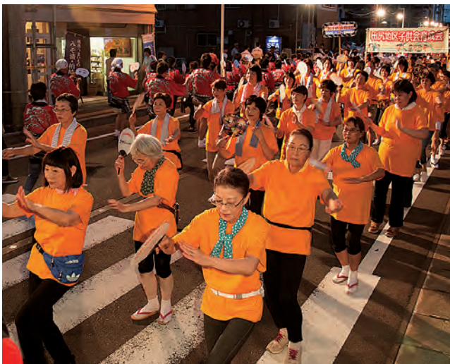
お揃いの黄色いTシャツで息もピッタリ!!