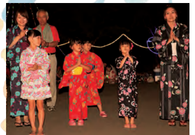
夏祭りには定番の浴衣。 踊りも艶やかです。