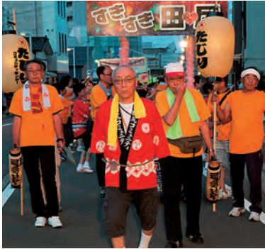
先陣を切るはこの面々

7月24日 地域の皆さんと子供育成会の皆さん合わせて280名の参加となりました。