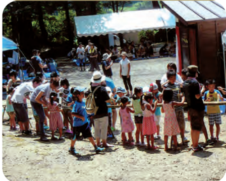
美味しい・楽しい! 流しそうめん