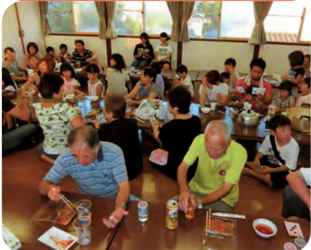
焼そばにビールがよく合います!!