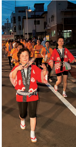
キレいに揃っています!!