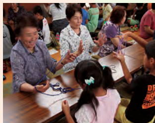
あやとり、うまくできたかな