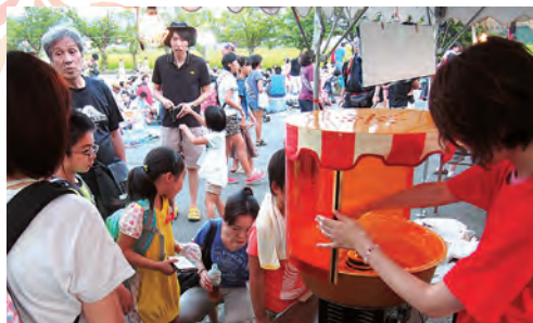
綿あめは小さな子どもさんに大人気!! スタッフも手際よくカタチにしています。