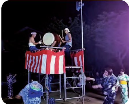
浴衣で踊れば気分もサイコー!!