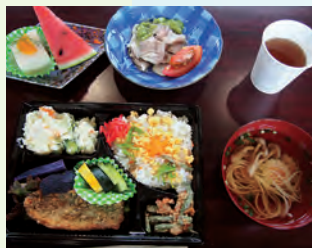
バラエティ豊かな食事です