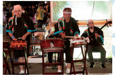
いろいろな太鼓があります。 音もそれぞれ違います。