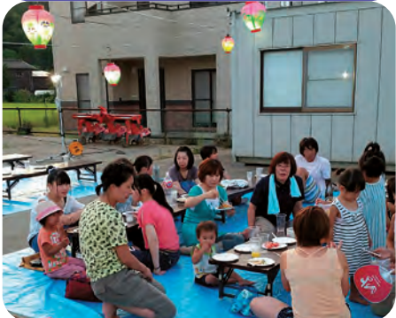
ちようちんがいい雰囲気です！