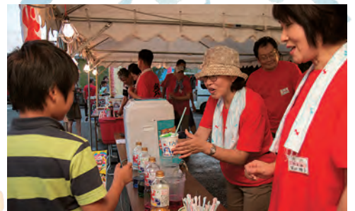
夏はやっぱり、かき氷ですね!! 猛暑のためフル回転です。