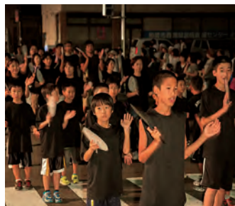
みんなで踊るって楽しいです