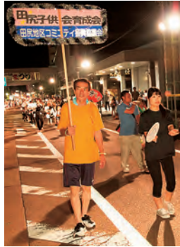
プラカード持ちも大変です!!