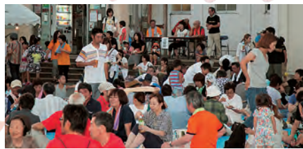
沢山のみなさんからおいでいただき 大変混み合いました。