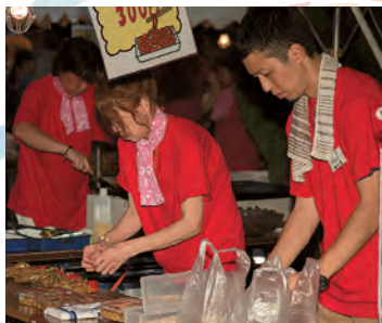
焼そばづくりは大忙し!! プロ級の腕前です。

今年の夏まつり会場には溢れんばかりの人・人・人!! 大賑わいです。 二階の窓や会場にはイルミネーション。とてもキレイで目を引きまます。設営は夢拓塾の皆さまです。