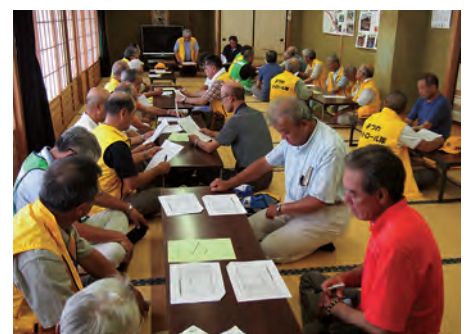
終了後の情報交換