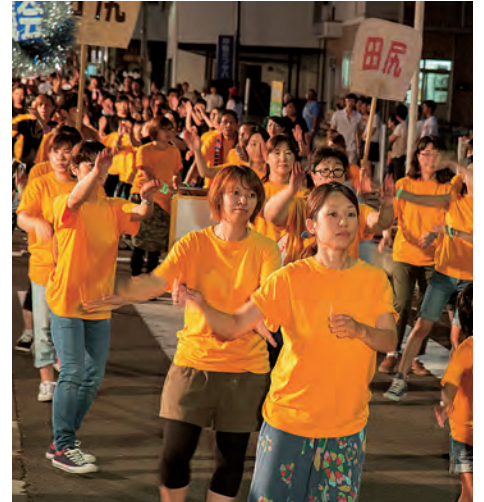
熱気あふれる踊りを披露