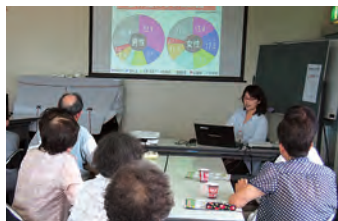
保健師さんからの説明