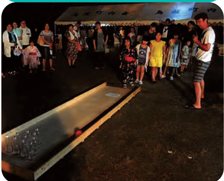
ストライクになって～