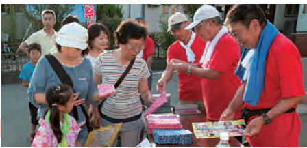
参加賞は手ぬぐいと花火です。 お楽しみの抽選券も配布しました。