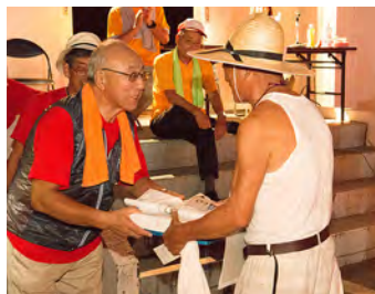
輝く、仮装部門第1位!! おめでとうございます。