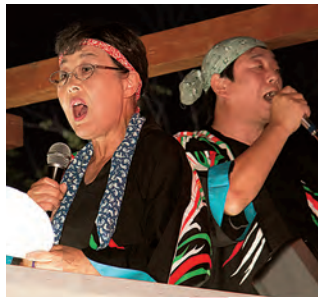
聞かせてくれます。 盛り上がりも最高潮に!!