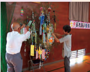
七夕の短冊に願いを込めて