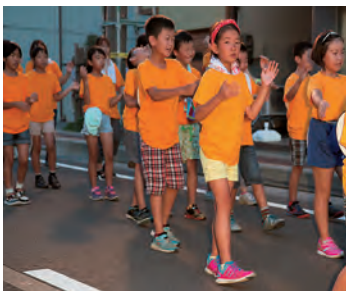
練習の成果を見てください