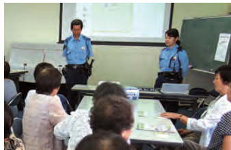
交番所長さんからの説明

途中の休憩には美味しいお菓子とお茶を楽しみ、楽しく勉強会を終了することができました。スライドを使用し、時々講師より補足説明が入り、第2部では軽いテストがあったりと、より分かりやすく確認できたと思います。