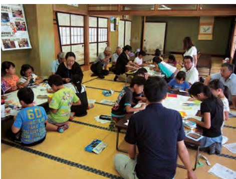
うまくまとまったかな？