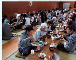
おいしくいただきました