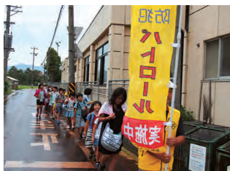
のぼり旗を先頭に下校中