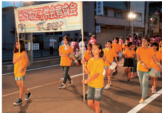
大勢参加の田尻地区子供会育成会