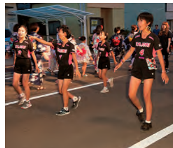
お揃いのユニホームで踊ります! お囃子に合わせて元気に掛け声