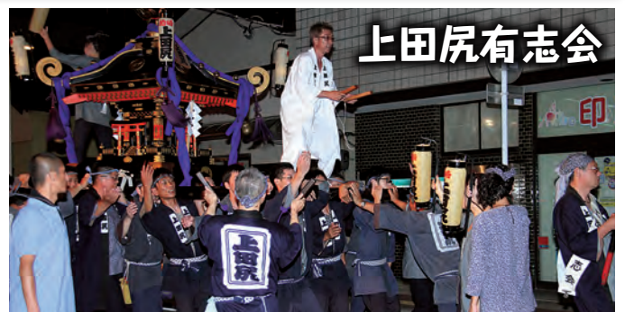
みんな、準備はいいかなー! これから出発するよー