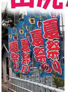
各町内からの絵あんどん