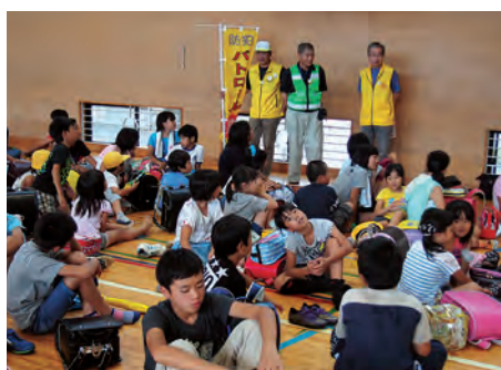
下校を前に注意点を聞きます