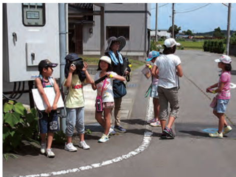
さて、どっちに行こうか？

午前にオリエンテーションとして防犯上危険な場所を学習し、3班に分かれて通学路を中心に近辺を回りました。みんなで考えながら写真を撮ったり地域の人にインタビューしたりしました。その後、コミセンに戻り、マップ作りに取り組みました。お昼にはコミセン主事さんの手作り特製カレーライスを食べ、午後にもマップ作りに励みました。最後に出来たマップを見ながら発表を行いました。身をもって危険な場所を確認できました。ご協力いただいた保護者、セーフティよつわ委員、地域の皆さま、ありがとうございました。