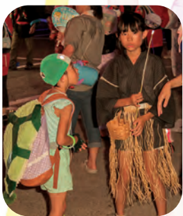
浦島太郎、なかなかです。 亀もいい感じですよ。