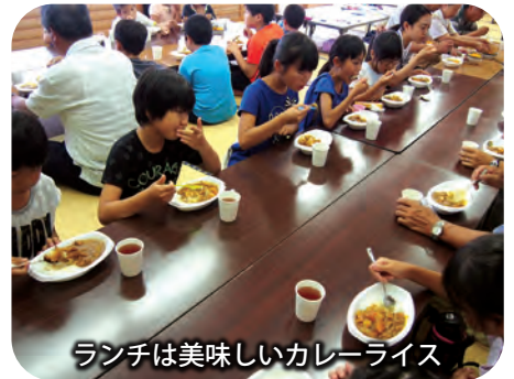
ランチは美味しいカレーライス