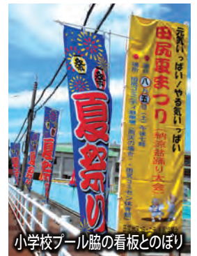
小学校プール脇の看板とのぼり