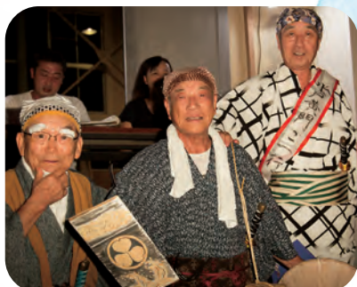
水戸黄門ご一行様さまが仮装部門 40周年特別賞(団体の部)