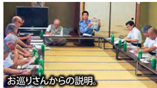
お巡りさんからの説明。