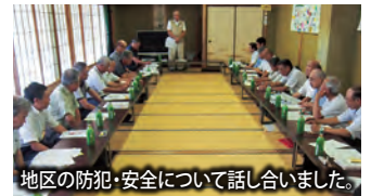
地区の防犯・安全について話し合いました。