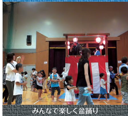
みんなで楽しく盆踊り