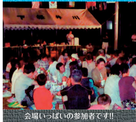
会場いっぱいの参加者です!!