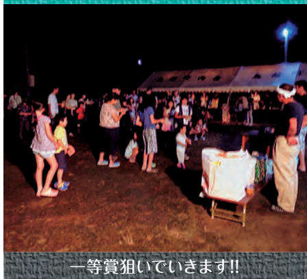
一等賞狙いでいきます!!