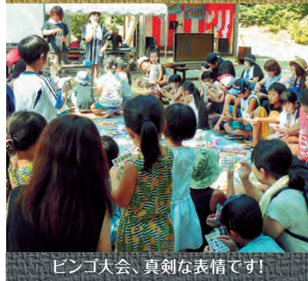
ビンゴ大会、真剣な表情です!