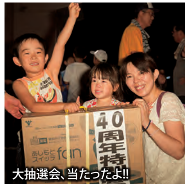
大抽選会、当たったよ!!