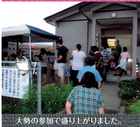
大勢の参加で盛り上がりました。