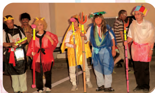
三蔵法師ご一行様、決まっています!! 後ろには、ピコ太郎?らしき姿も。