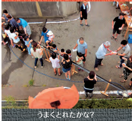
うまくとれたかな？