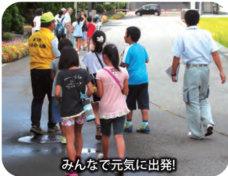
みんなで元気に出発!

このように子どもたちだけでなく、地域全体が子どもたちの安全や防犯面に留意が必要であると感じた一日でした。