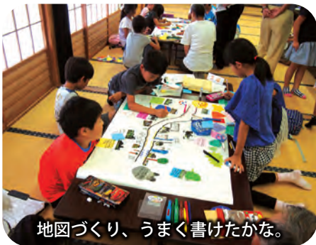
地図づくり、うまく書けたかな。