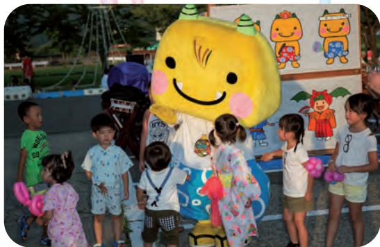
大人気のえちゴン!! 子どもたちにとり囲まれてしまいました。