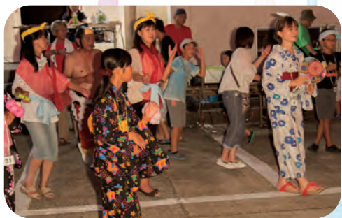
浴衣での盆踊りって とってもいいですね!!