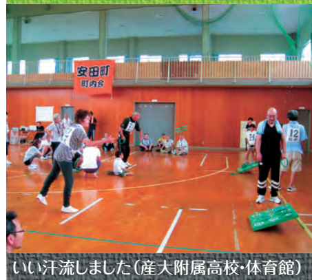
いい汗流しました(産大附属高校・体育館)