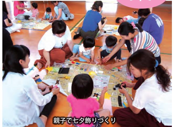
親子で七夕飾りづくり