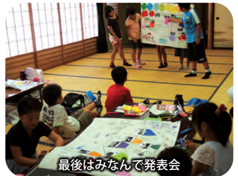
最後はみんなで発表会