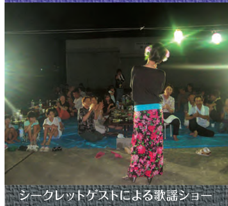
シークレットゲストによる歌謡ショー