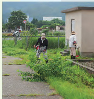
コミセン体育館脇