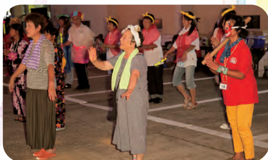
今年の仮装はバラエティ豊か!! 色々な格好で祭りを盛り上げます。