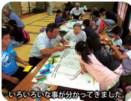
いろいろな事が分かってきました。