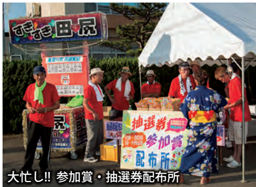
大忙し!! 参加賞・抽選券配布所