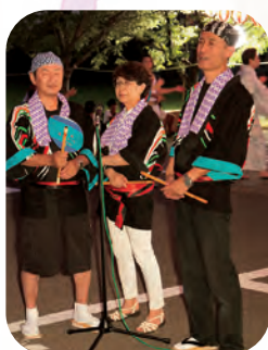
生演奏で盛り上げます!! 田尻おんど会