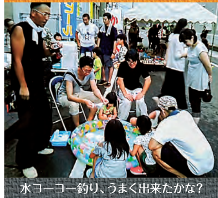
水ヨーヨー釣り、うまく出来たかな？