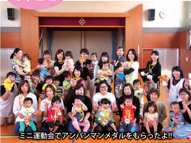
ミニ運動会でアンパンマンメダルをもらったよ!!