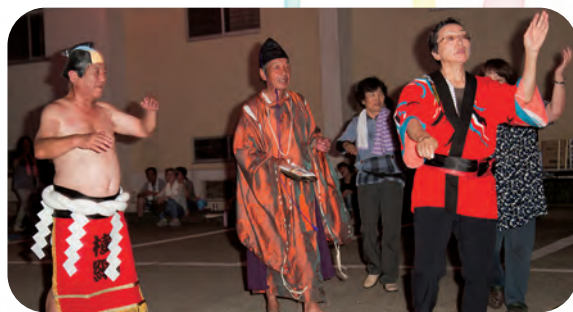
お相撲さんも踊ります。行司さんも踊ります。 みんなで楽しく踊ります。