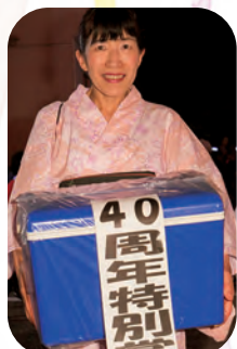
大当たり!! 40周年特別賞。 おめでとうございます!!