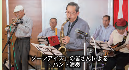
「ソーンアイズ」の皆さんによるバンド演奏