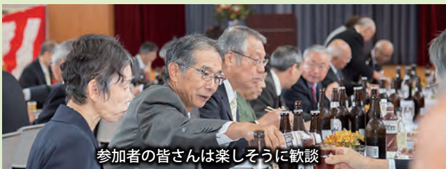
参加者の皆さんは楽しそうに歓談