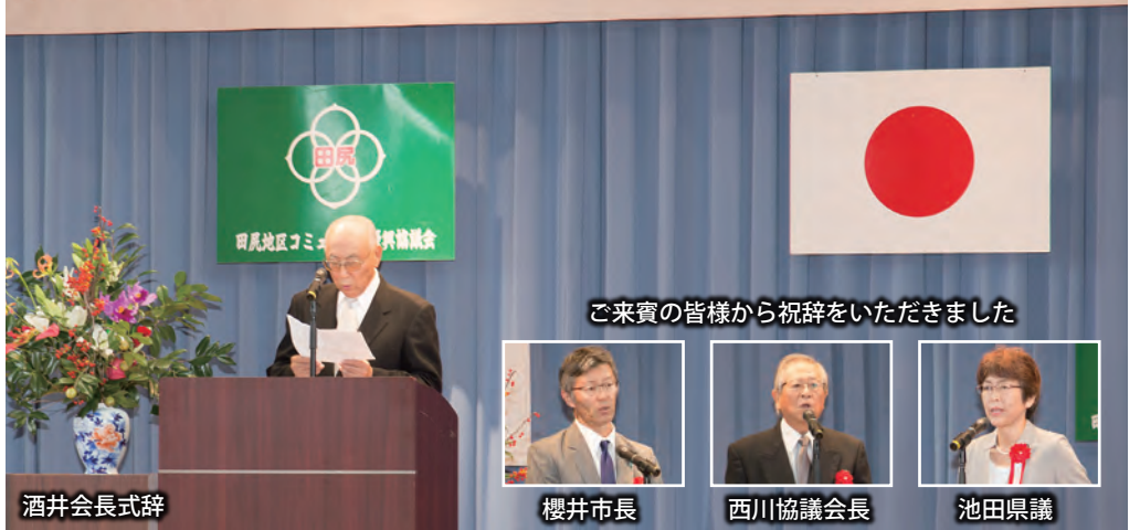
ご来賓の皆様から祝辞をいただきました