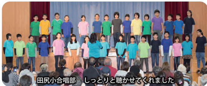
田尻小合唱部 しっとりと聴かせてくれました