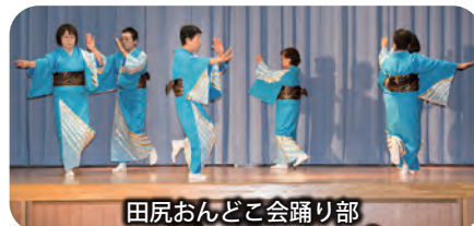
田尻おんどこ会踊り部