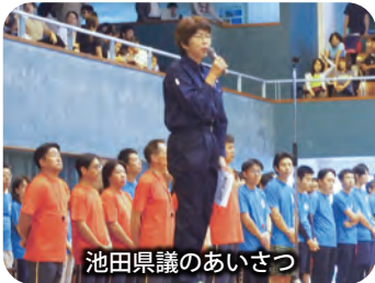
池田県議のあいさつ