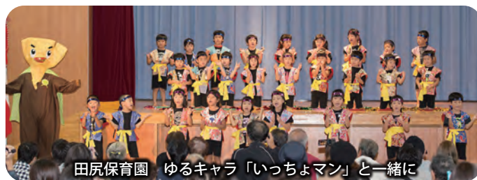
田尻保育園 ゆるキャラ「いっちょマン」と一緒に