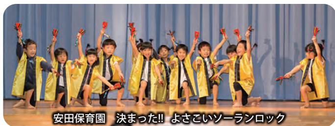
安田保育園 決まった!! よさこいソーランロック