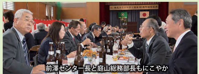
前澤センター長と庭山総務部長もにこやか