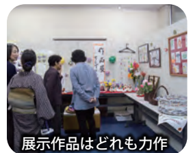
展示作品はどれも力作