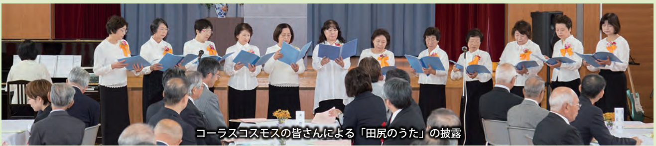
コーラスコスモスの皆さんによる「田尻のうた」の披露