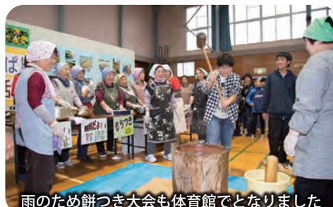
雨のため餅つき大会も体育館でとなりました