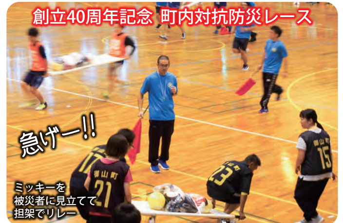
創立40周年記念 町内対抗防災レース