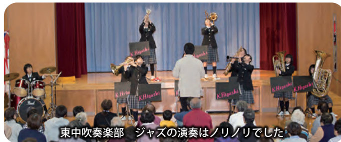
東中吹奏楽部 ジャズの演奏はノリノリでした