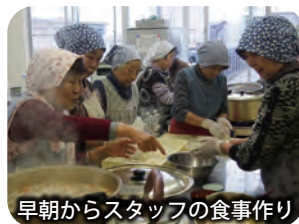
早朝からスタッフの食事作り