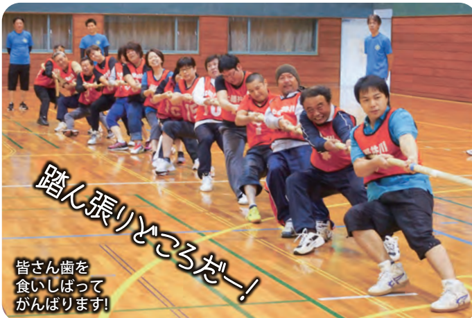
踏ん張りどころだー! 皆さん歯を 食いしばって がんばります!