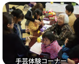
手芸体験コーナー