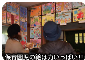
保育園児の絵は力いっぱい!!