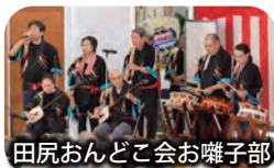
田尻おんどこ会お囃子部