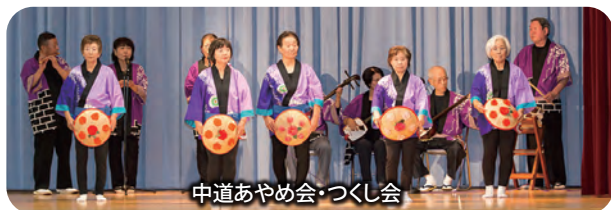
中道あやめ会・つくし会