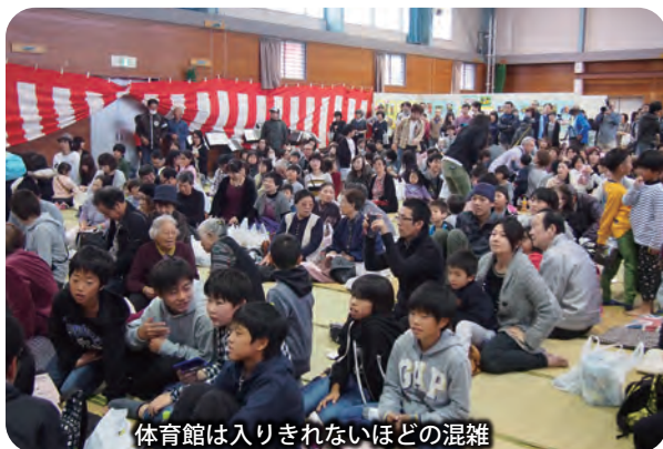
体育館は入りきれないほどの混雑