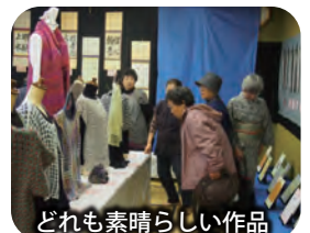
どれも素晴らしい作品