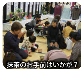
抹茶のお手前はいかが？