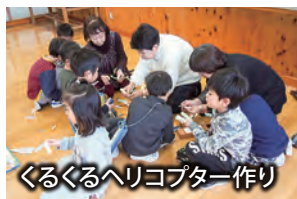
ぐるぐるヘリコプター作り