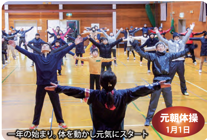
一年の始まり。体を動かし元気にスタート