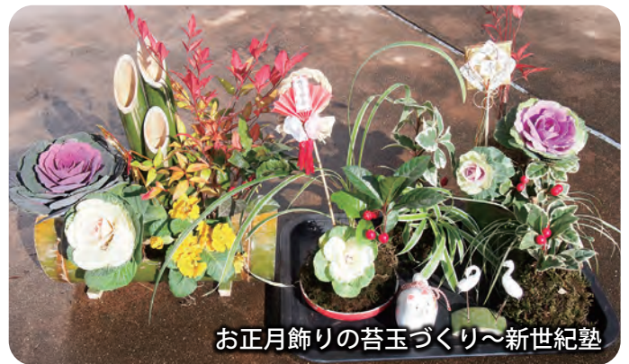
お正月飾りの苔玉づくり～新世紀塾