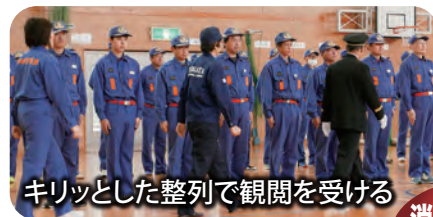
キリッとした整列で観閲を受ける