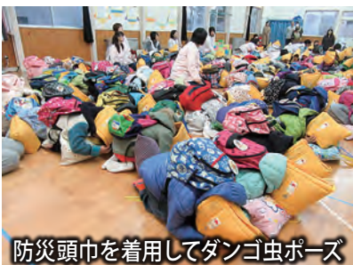
防災頭巾を着用してダンゴ虫ポーズ

保育園では避難訓練実施計画に基づき、様々な災害を想定して毎月避難訓練を実施しています。11月は「防災頭巾の着用の仕方」そして「ダンゴ虫ポーズでの身の守り方」など子ども達の避難の様子を保護者の皆様にご覧いただき、その後引き渡し訓練を行いました。災害時に間違いなく保護者様にお子さんをお渡しできるように迎えの方のお名前・迎え時間など職員は2人1組で確認作業を行いました。地域の皆様には、これからも幼い大切な命を守るためのご協力とご支援をお願いできればと思います。