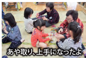
あや取り、上手になったよ