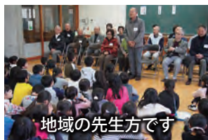
地域の先生方です

子どもたちに昔の遊びを知ってもらいながら地域の お年寄りと仲良くなろうと毎年行われています。