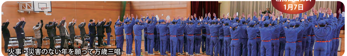
火事・災害のない年を願って万歳三唱