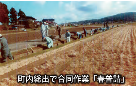
町内総出で合同作業「春普請」

春になれば、フキノトウ、ワラビ、ゼンマイ、タケノコ、等々沢山の山菜が芽吹きます。初夏には、蛍が飛びかいます。秋になれば、キノコ、クリ、アケビ、ジネンジョなどがとれます。安田地区6町内会ある中で、川の最上流部に位置します。明神地内には2つの川が流れています。この川を維持・管理するために、春に町内総出で合同作業として「春普請」を1日かけて行い、次の町内へきれいな水を送るためみんなで頑張っています。夏に青年