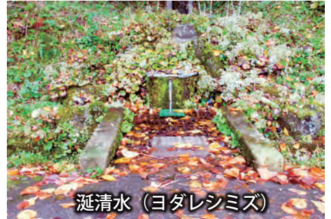
涎清水（ヨダレシミズ）

涎清水（ヨダレシミズ）と呼ばれる名水が、こんなに湧き出ています。市道のすぐ横ですので、皆様も1回試されて見てはいかがですか。