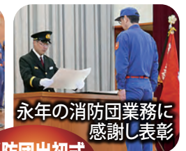
永年の消防団業務に 感謝し表彰