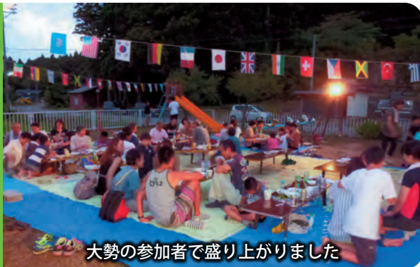
大勢の参加者で盛り上がりました