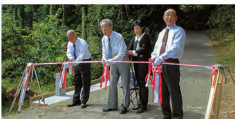
材質 亜鉛-アルミニウム-マグネシウム合金メッキ+高耐候性樹脂粉体塗装