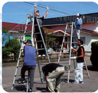
早朝準備の ウェルカムアーチ