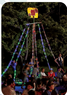
ペットボトルツリー とても綺麗です