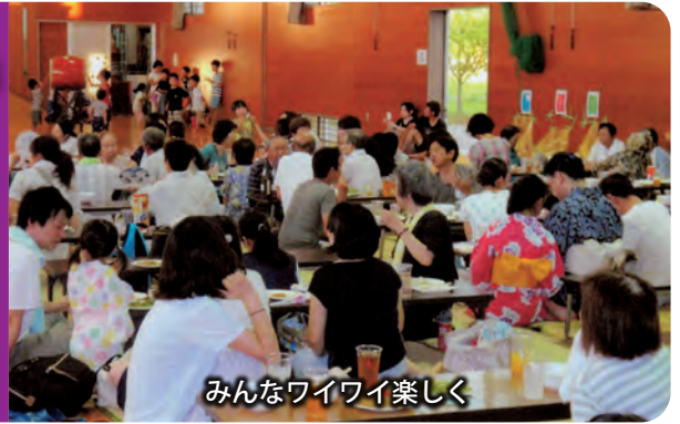
みんなワイワイ楽しく