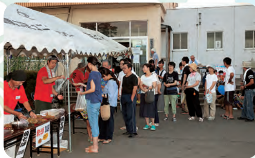
大人気の焼きそば 長蛇の列です!