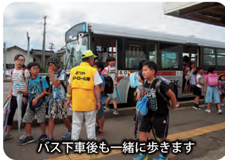
バス下車後も一緒に歩きます