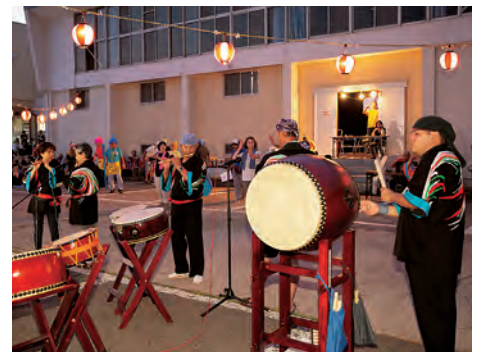
おんどこ会の皆さんによるお囃子