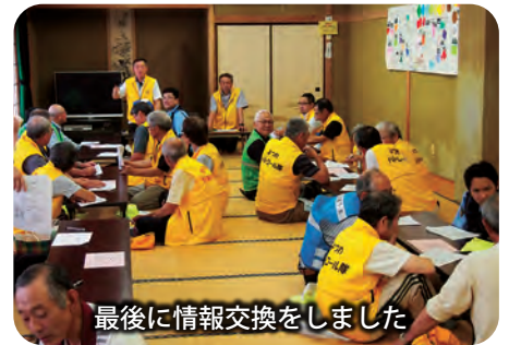
最後に情報交換をしました