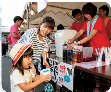
わあ〜! かき氷 冷た〜い!!