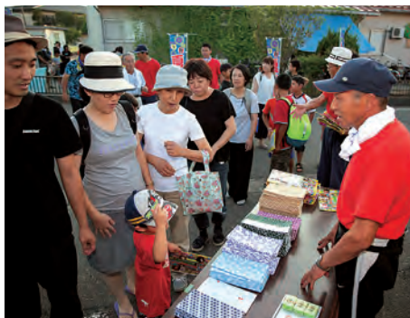
今年の参加賞は絵柄手ぬぐいとこども花火