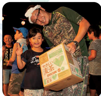
大抽選会では、たくさんの賞品が用意されました 当たった皆さん、おめでとうございます