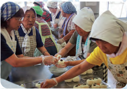
ボランティアの皆さんによる スタッフの夕食用おにぎり作り

8月4日(土)、第10回「田尻夏まつり」がコミセン駐車場をメイン会場に開催されました。今年も大勢の方々より参加いただき、スタッフ合わせて900人でした。この祭りの特徴はお子さん連れの若いご夫婦や家族連れが沢山参加されることです。田尻の勢いが満ちあふれるお祭でした。