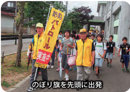
のぼり旗を先頭に出発