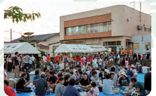
まつり会場には人、人、人 大盛況です