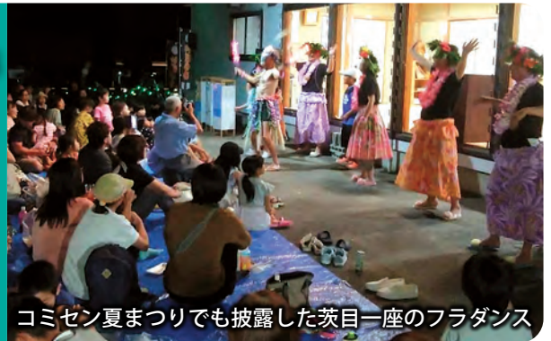
コミセン夏まつりでも披露した茨目一座のフラダンス