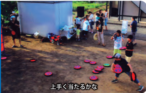
上手く当たるかな