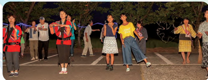
老若男女問わず、とても楽しそうに 踊っていらっしゃいますね