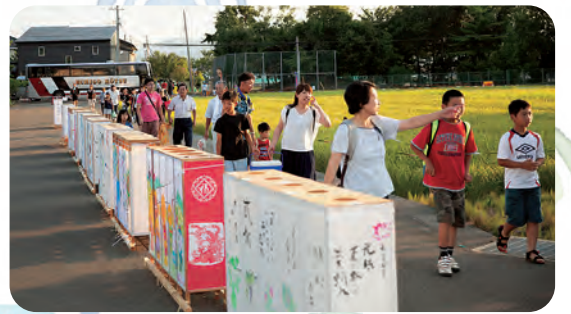
送迎バスが到着し いよいよ会場が混んできます