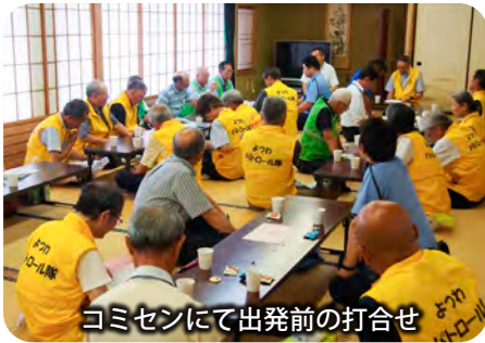
コミセンにて出発前の打合せ

事故は、不安全な状態と不安全な行動が重なった時に発する。「歩道がない」「信号がない」など、不安全な状態は山積している。「あるべき姿」＝理想像に近づけるため、少しずつ、一歩ずつ、現状を打破し、改善しなければならない。着実に実行し、不安全な状態「ゼロ」を目指そう。