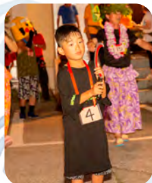
仮装大賞目指して 頑張りました!!