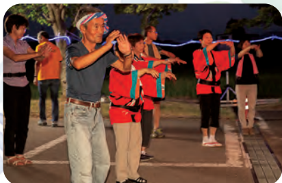
踊りも最高潮! 赤い法被はおんどご会のみなさん