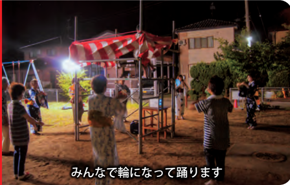
みんなで輪になって踊ります