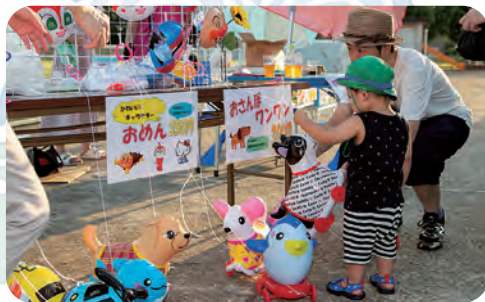
いっしょにお散歩 しょうよワン!