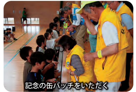
記念の缶バッチをいただく