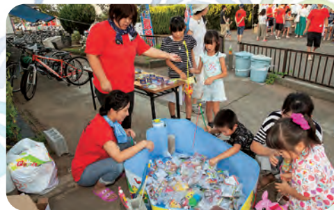
何が釣れるかな? 子供ゲームコーナー