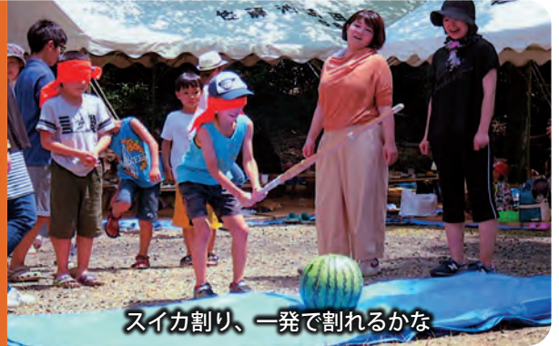
スイカ割り、一発で割れるかな