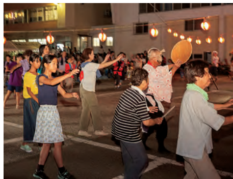
仮装盆踊りで大盛り上がり