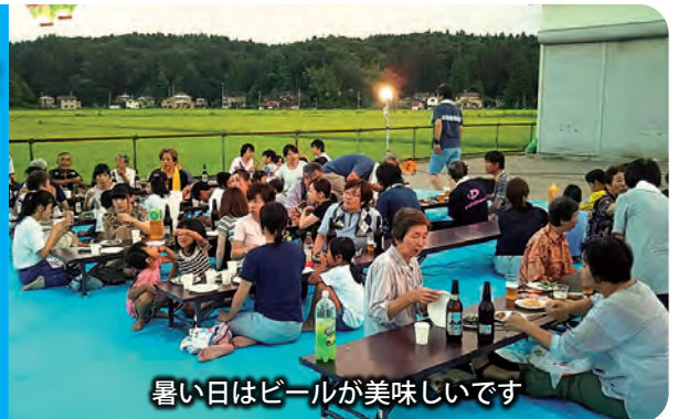
暑い日はビールが美味しいです