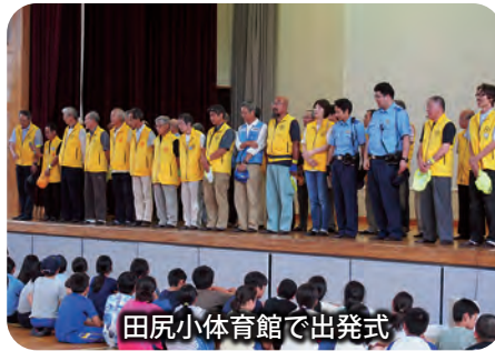
田尻小体育館で出発式