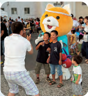
高柳のゆるキャラ 「こーたん」が登場