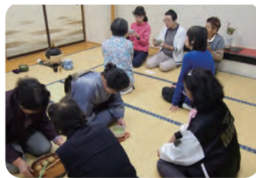
饅頭付きの抹茶サービス