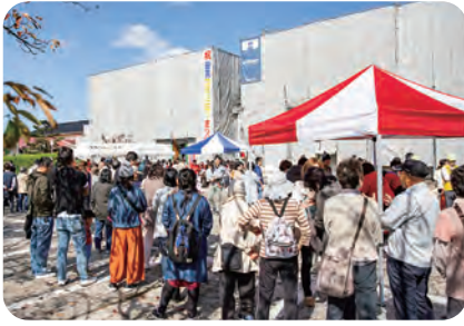
建物は工事中ですが、すごい人出!