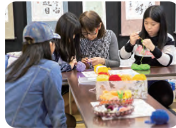
手芸体験コーナー