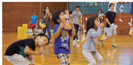
大きな口でパクリ! パン食い競争