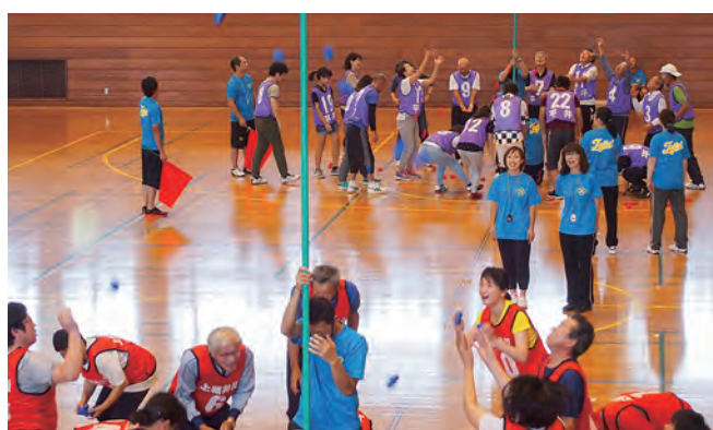
「せーの」でタイミング合わせて。なかなか入らない玉入れ