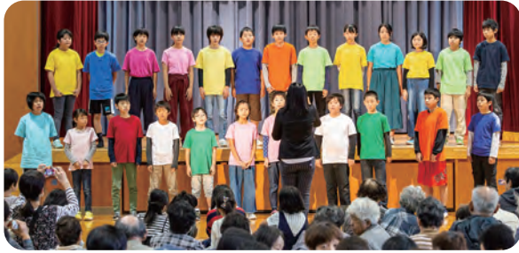
田尻小学校合唱部