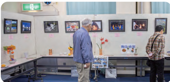
写真と陶芸の展示