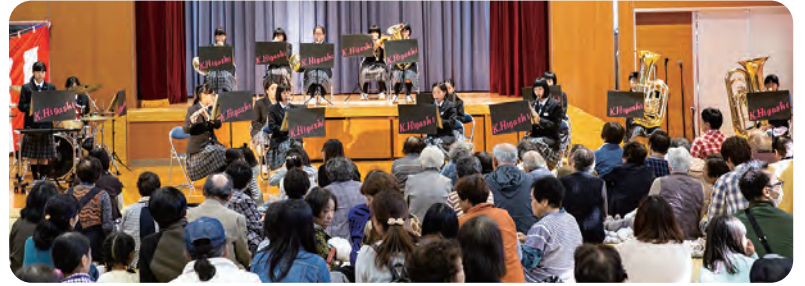
東中学校吹奏楽部