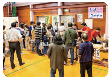
体育館の売店コーナー