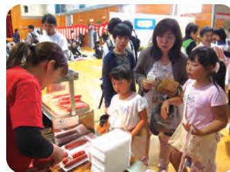
フランクも早々に売り切れました