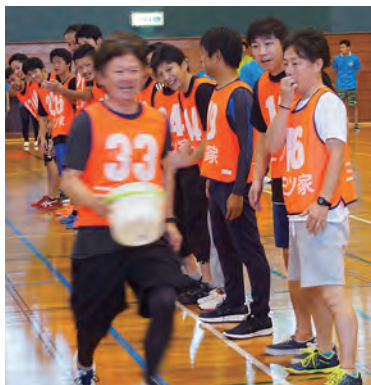
防災レース、頭も結構使います!