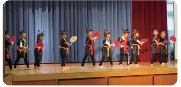
安田保育園のおゆうぎ