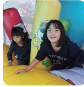
フワフワ内部はこんな感じ