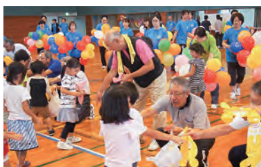
ちびっ子ががんばれ、幼児レース