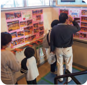
階段踊り場の写真展示