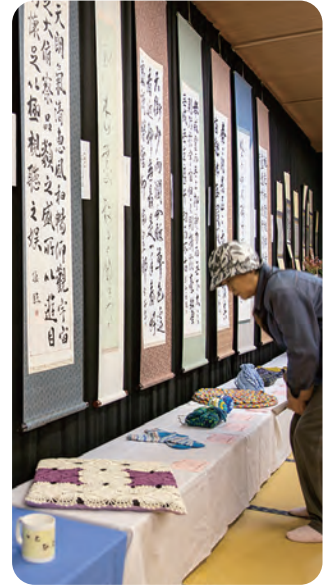
素晴らしい作品の数々