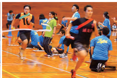
ボール掃き転がしレース