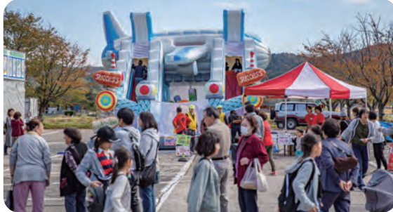
今年もふわふわ登場!!