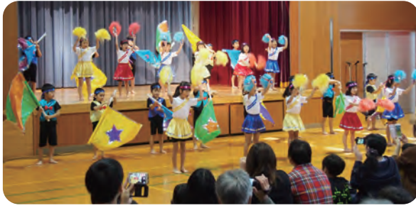
田尻保育園のおゆうぎ