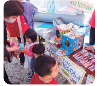
お楽しみ、たまごくじ