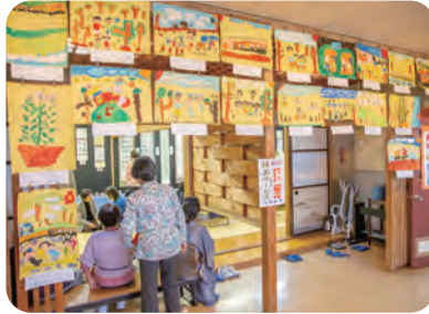
2階ロビーの園児の絵