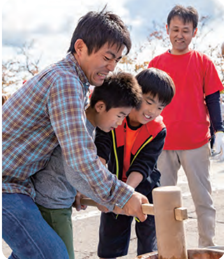
ちびっ子達も大人に負けずに杵を振ります

大規模改中で駐車場は狭く、館内は天井が外され暗い状態でしたが、両日で約1,000人の人出。会場は大変盛り上がりしました。