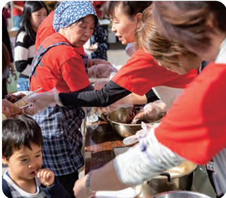
おいしい杵つき餅です