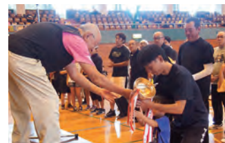
やりました!! 優勝カップ