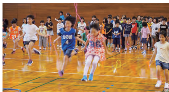
なわ跳びも軽やかに! 障害物レース