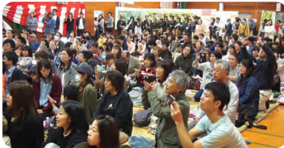
満員御礼! ありがとうございます