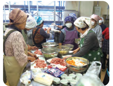
スタッフ用昼食作りボランティア