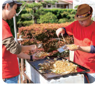
大人気の焼きそば