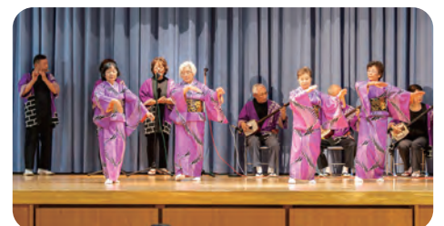
中道あやめ会・つくし会