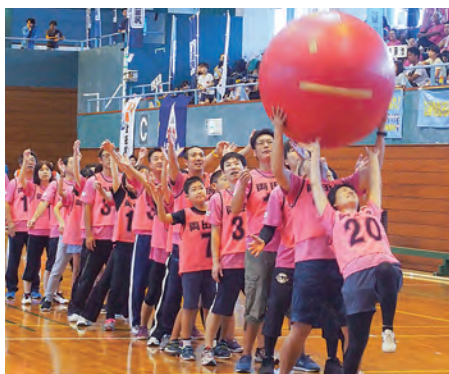
大玉を上げるのに結構苦戦! 大玉小玉送り