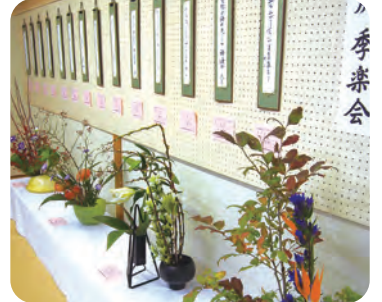
どれも力作、作品展示