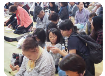
お楽しみビンゴ大会