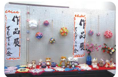
てもずらの会の作品