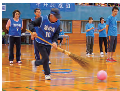
力が入ります! ボール掃き転がしレース