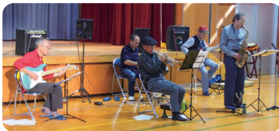
バンド演奏はソーンアイズのみなさん