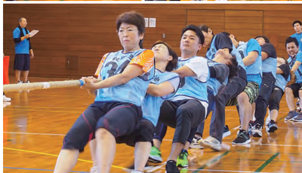
力と力のぶつかり合い。綱引き