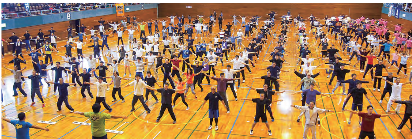
これからの熱戦に備えて、みんなで準備体操