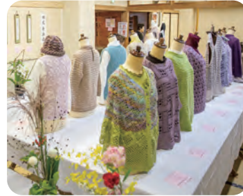
生け花・手芸展示