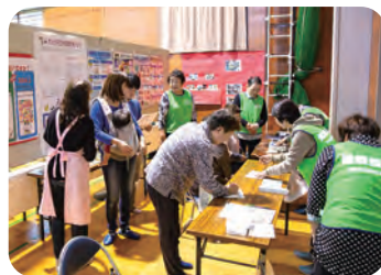
食推・健推コーナー