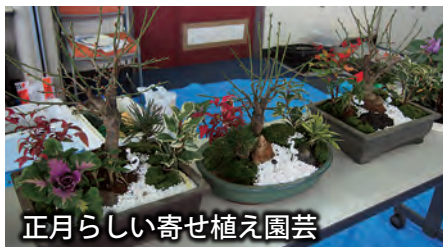
正月らしい寄せ植え園芸