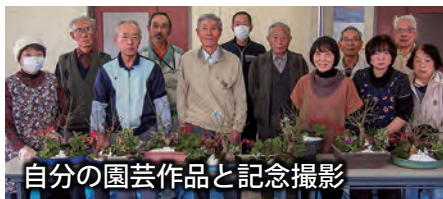
自分の園芸作品と記念撮影