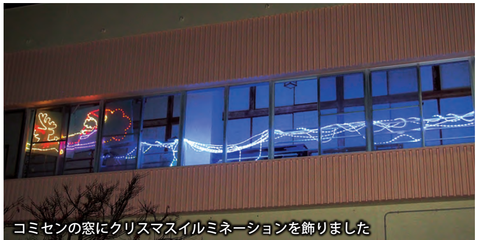
コミセンの窓にクリスマスイルミネーションを飾りました