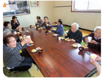
12/16 上田尻集落開発センター