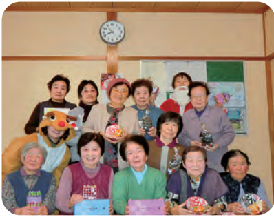
12/13 下田尻ふれあいセンター