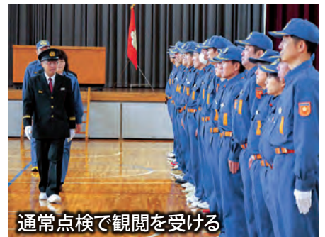
通常点検で観閲を受ける