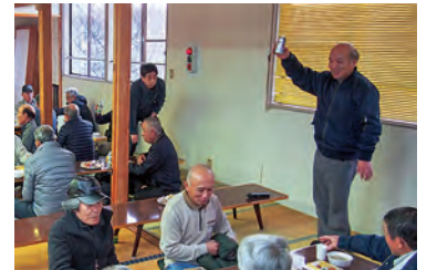
中道町内会長さんの歓迎挨拶と乾杯

天気は午後から回復したものの気温が上がらず屋外での開催を断念して大広間での開催にしました。大勢の方からご参加いただき、広間がほぼ満席となり120食用意したお弁当もすべて売り切れました。日が暮れ、イルミネーションやライトアップが窓からきれいに見えました。