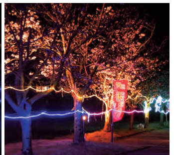
コミセンの駐車場もライトアップ