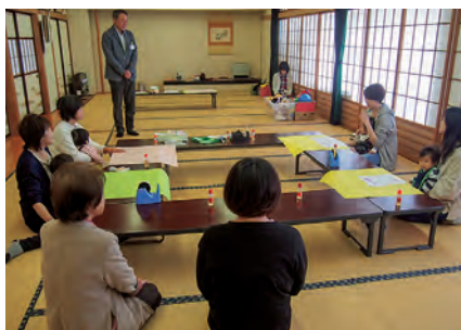
開講式でセンター長あいさつ