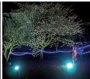
良い感じにできてます