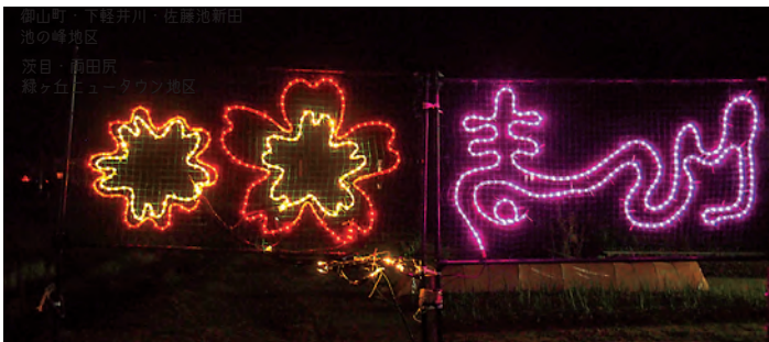
夢拓塾作成、桜の花形イルミネーション