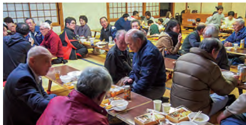
美味しいお弁当とお酒で楽しそうです