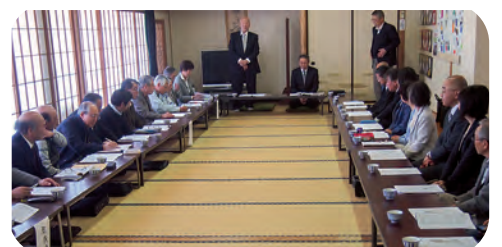
コミセン総会の様子

令和元年のコミセン関係事業は、概ね例年通りです。特に記念事業などは予定しておりませんが、地域の皆さま、そして関係各位の皆さまのご理解とご協力をお願い申し上げます。そして関係各位の皆さまのご理解とご協力をお願い申し上げます。そして関係各位の皆さまのご理解とご協力をお願い申し上げます。