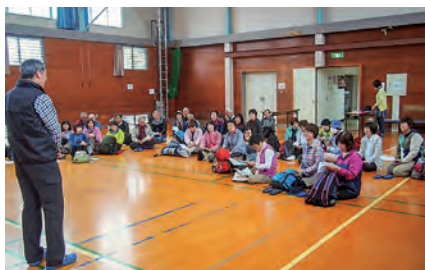
コミセン体育館で開講式

4月25日(木)、たじり新世紀塾の開講式が行われました。会員は昨年度より5名増え、80名になりました。開講式の後には、見附市大平森林公園に。鴨の行列の出迎えが雨が降りしきる重い空気感を変えてくれました。ウグイスのさえずり、木々の芽吹きに季節の移ろいを感じながら園内を一周。帰路、道の駅パティオで休憩とショッピングを楽しみ、無事帰途につきました。人生百年を生き抜くための最重要課題は、心身の健康づくりにあり、微力ながら推進員としてサポートしていきたいです。