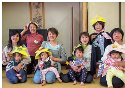
できた兜で記念撮影