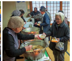
無料のトン汁配布