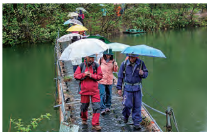
雨のため傘をさしてのウォーキング