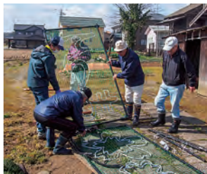
夢拓塾によるイルミネーション設置