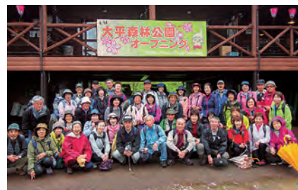
ロッジ管理棟前で記念撮影