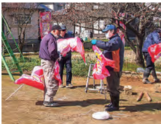
のぼり立ては地域振興部の皆さん