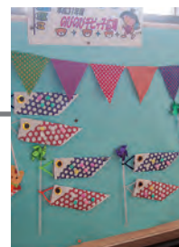
掲示板に飾りました

4月24日(水)のびのびチビッ子広場開講式を行いました。今回はこどもの日工作として、兜とこいのぼりを作りました。おやつタイムの後、キッズビクスで元気いっぱい体を動かしました。今年度は親子5組でスタートしましたが、まだまだ募集中ですのでコミセンまでお問合せください。ママ同士の仲間づくり・おばあちゃんの参加も大歓迎です。待ってまーす！