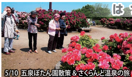
5/10 五泉ぼたん園散策 & さくらんど温泉の旅