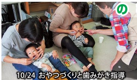
10/24 おやつづくりと歯みがき指導