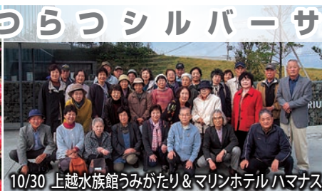
10/30 上越水族館うみがたり & マリンホテルハマナス