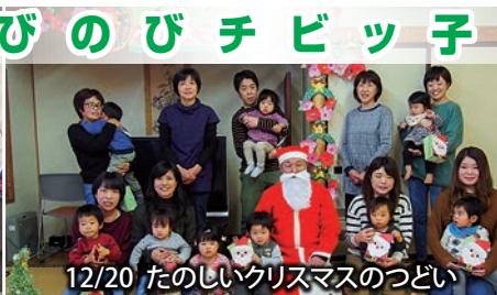
12/20 たのしいクリスマスのつどい