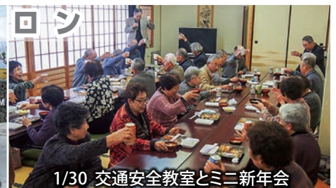
1/30 交通安全教室とミニ新年会