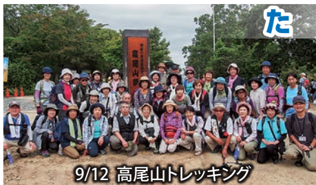
9/12 高尾山トレッキング