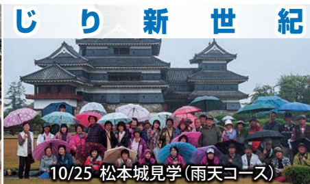
10/25 松本城見学（雨天コース）