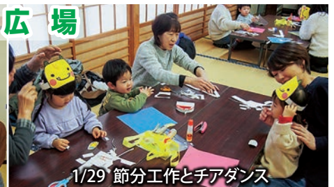
1/29 節分工作とチアダンス