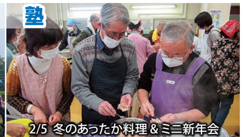
2/5 冬のあったか料理 & ミニ新年会