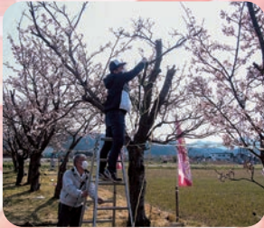
夢拓塾の皆さんによるイルミネーション取り付け