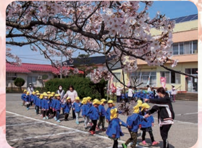
田尻保育園の子どもたちが花見に来ました