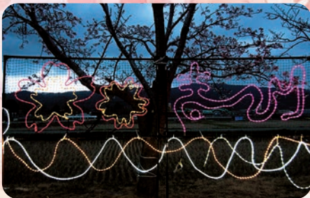
イルミネーションと桜の共演、とても幻想的です