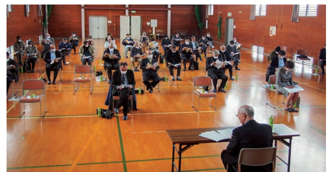
4/14 コミュニティ総会 コロナウイルスのため体育館にて開催