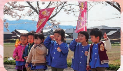
桜をバックに記念撮影