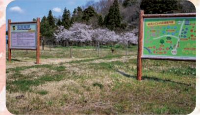
いこいの広場でも満開の桜

新型コロナウイルス感染拡大防止のため、今年の桜まつりは中止。しかし、地域振興部員・夢拓塾の皆さんにより、ライトアップとのぼり旗設置をしていただき、コミセン駐車場は例年通りの風景になりました。天気の良い日には田尻保育園の皆さんが遊びに来てくれて、桜を楽しんでいました。